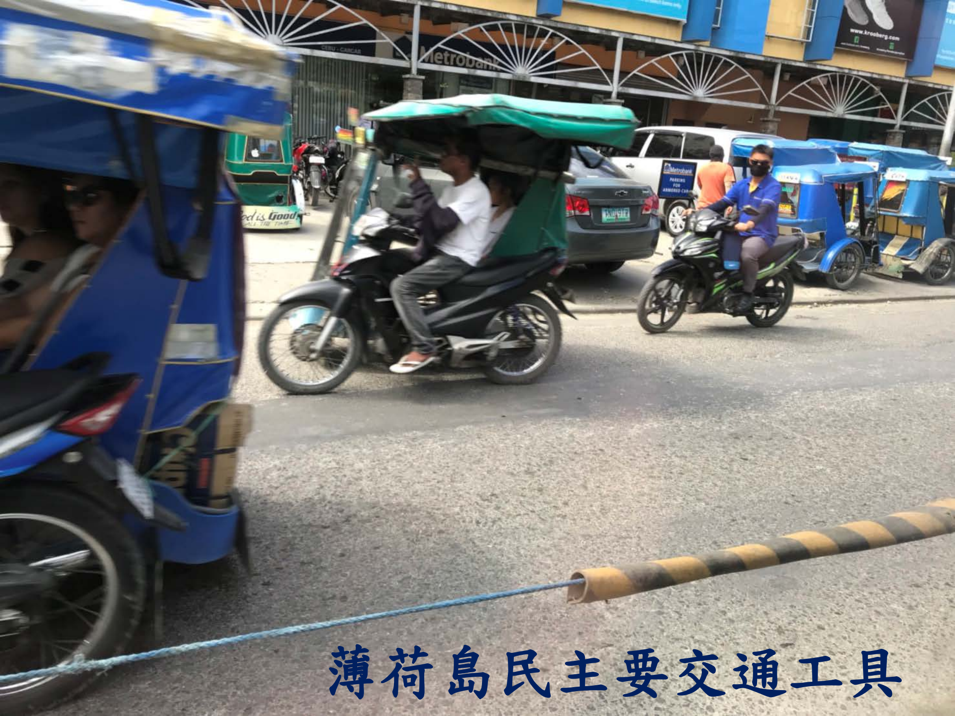
薄荷島民主要交通工具