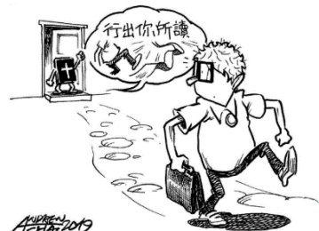
更會致力將神的道的生活出來

https://www.facebook.com/cartoonsforfaith